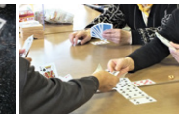
レクリエーション