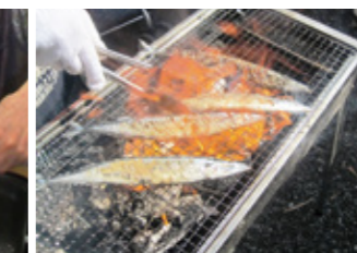
焼きたてさんまを味わう会