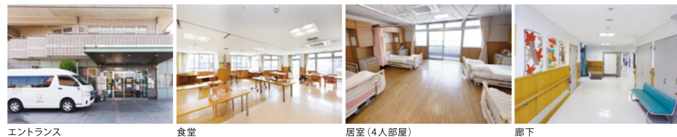
エントランス 食堂 居室(4人部屋) 廊下